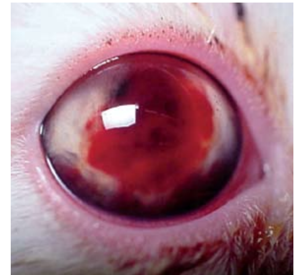
Albert Lloret engedélyével felhasználált felvétel