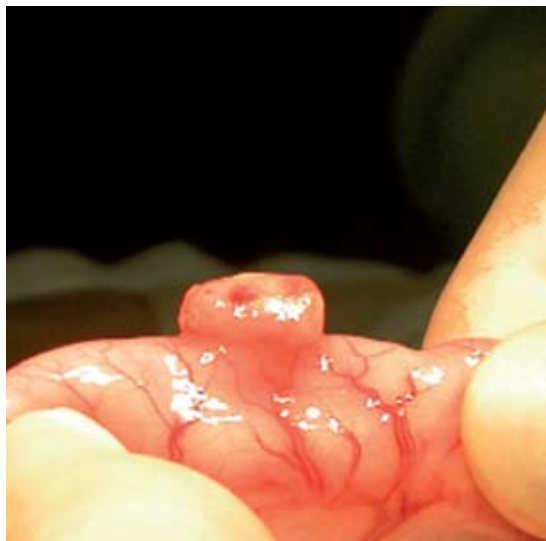
Kuva Julia Beatty