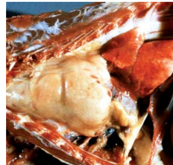
Kuva Marian C Horzinek